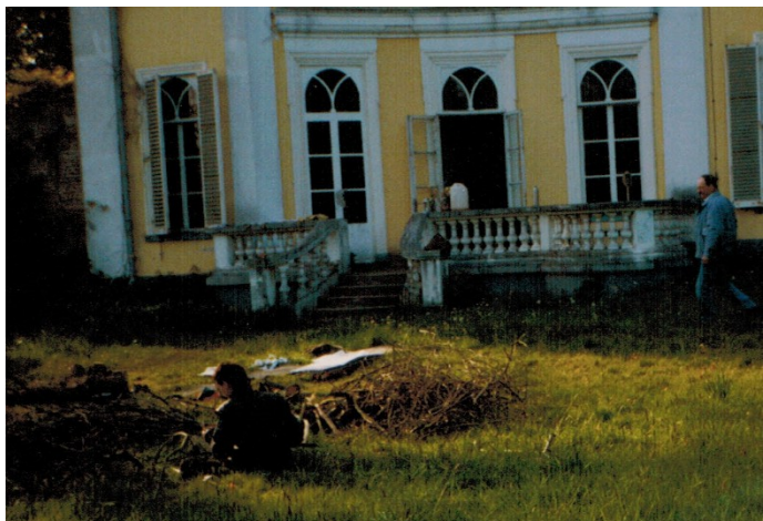
Op de foto's een bezoek van CLM aan de “krakers” van Landfort